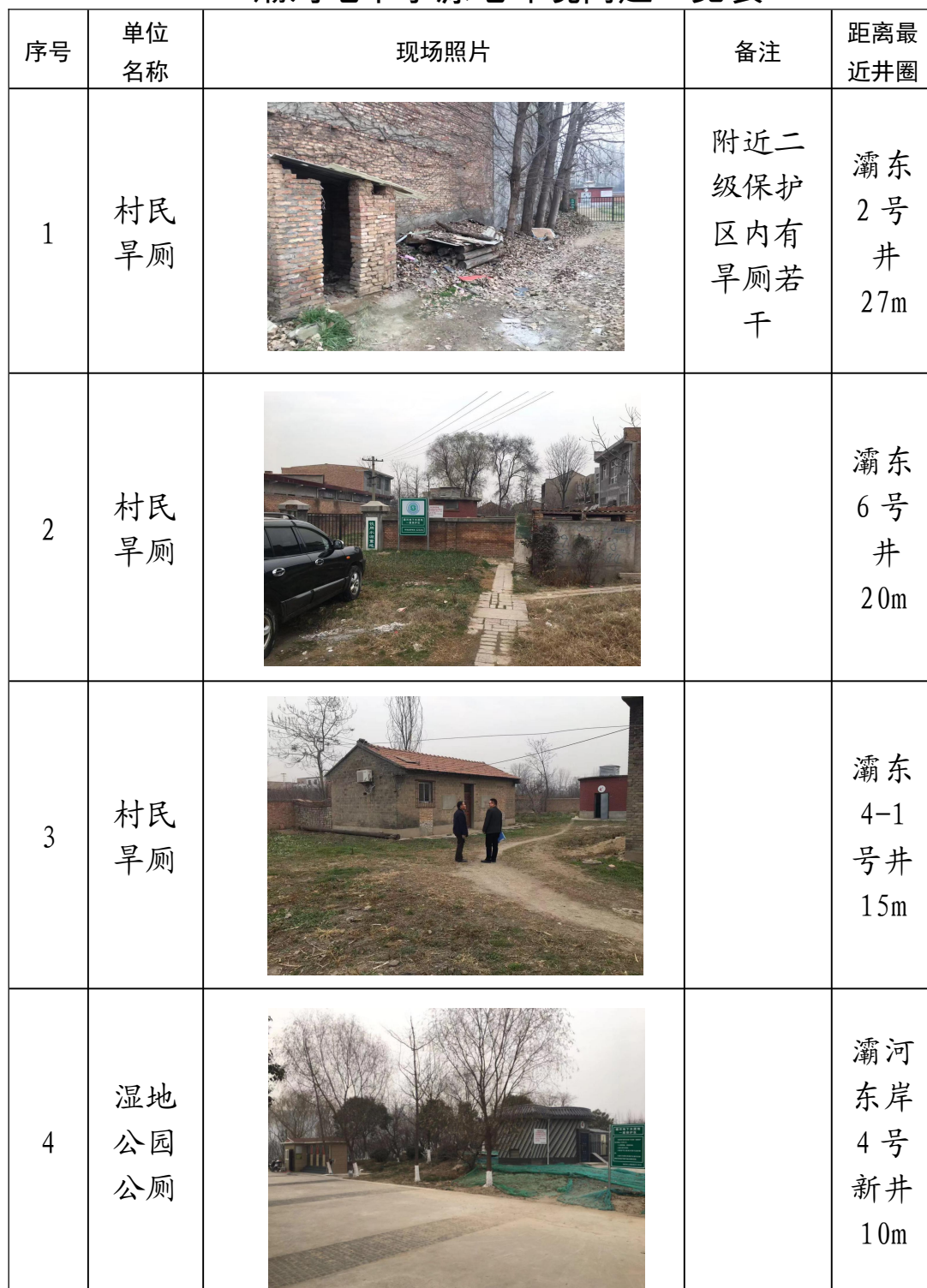
灞河地下水源地环境问题一览表