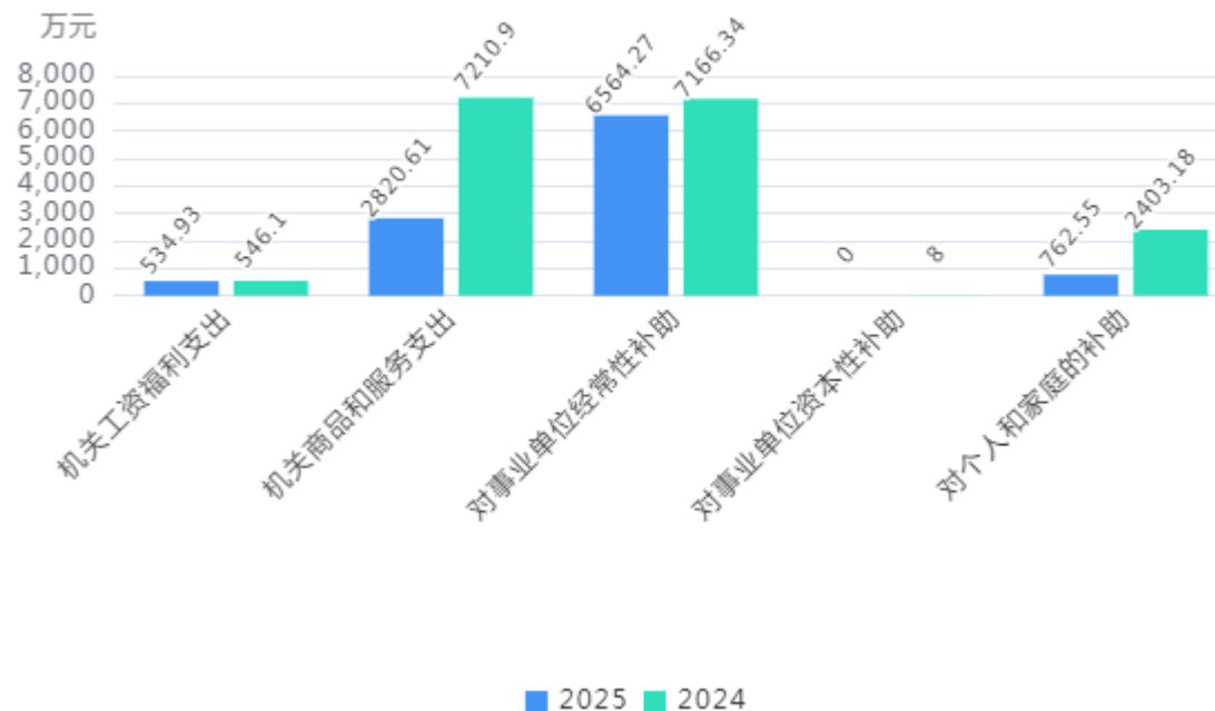
支出按政府预算支出经济分类对比图

（5）对个人和家庭的补助（509）762.55万元，较上年减少1,640.63万元，下降68.27%，下降的主要原因是：机构改革，将老龄事务划出，不再发放高龄老人生活保健补贴。