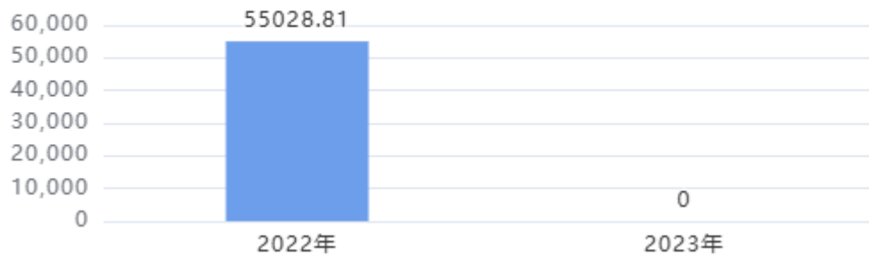
收入、支出决算总计对比图（单位：万元）