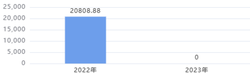
财政拨款收入、支出总计对比图（单位：万元）