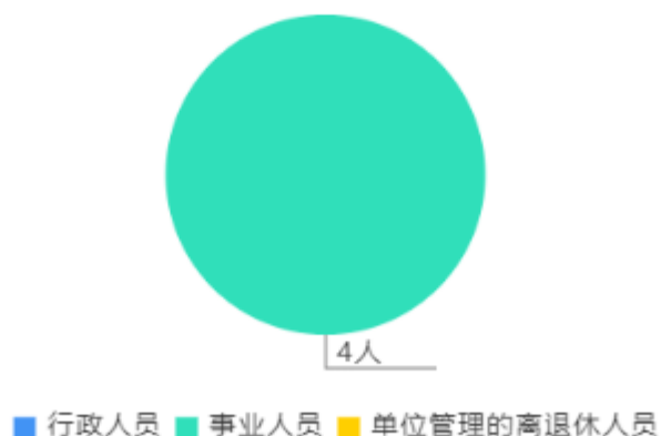
人员情况构成饼图