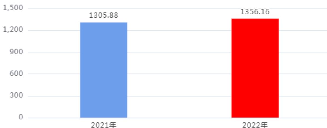
财政拨款支出对比图（单位：万元）

2022年度一般公共预算财政拨款支出年初预算1118.76万元，支出决算1,356.16万元，完成年初预算的121.22%，占本年支出合计的100%。与上年相比，财政拨款支出增加50.28万元，增长3.85%，增长的主要原因是：单位业务量的增加，及设备的购置。